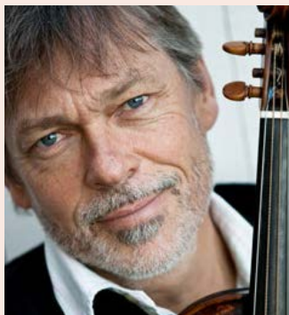
Foto Jordi Savall: Bárbara Rigón Verona Foto Le Concert des Nations: Teresa Llordes Foto Manfredo Kraemer: Tatiana Daubek